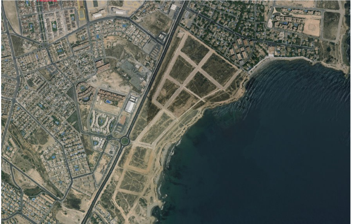
Ortofoto 3. Sector D-1 "Alameda del Mar", año 2009.