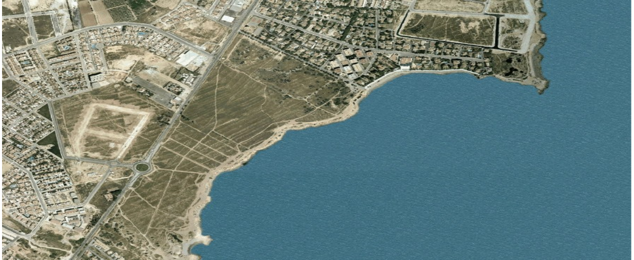
Ortofoto 1. Sector D-1 "Alameda del Mar", año 2002.