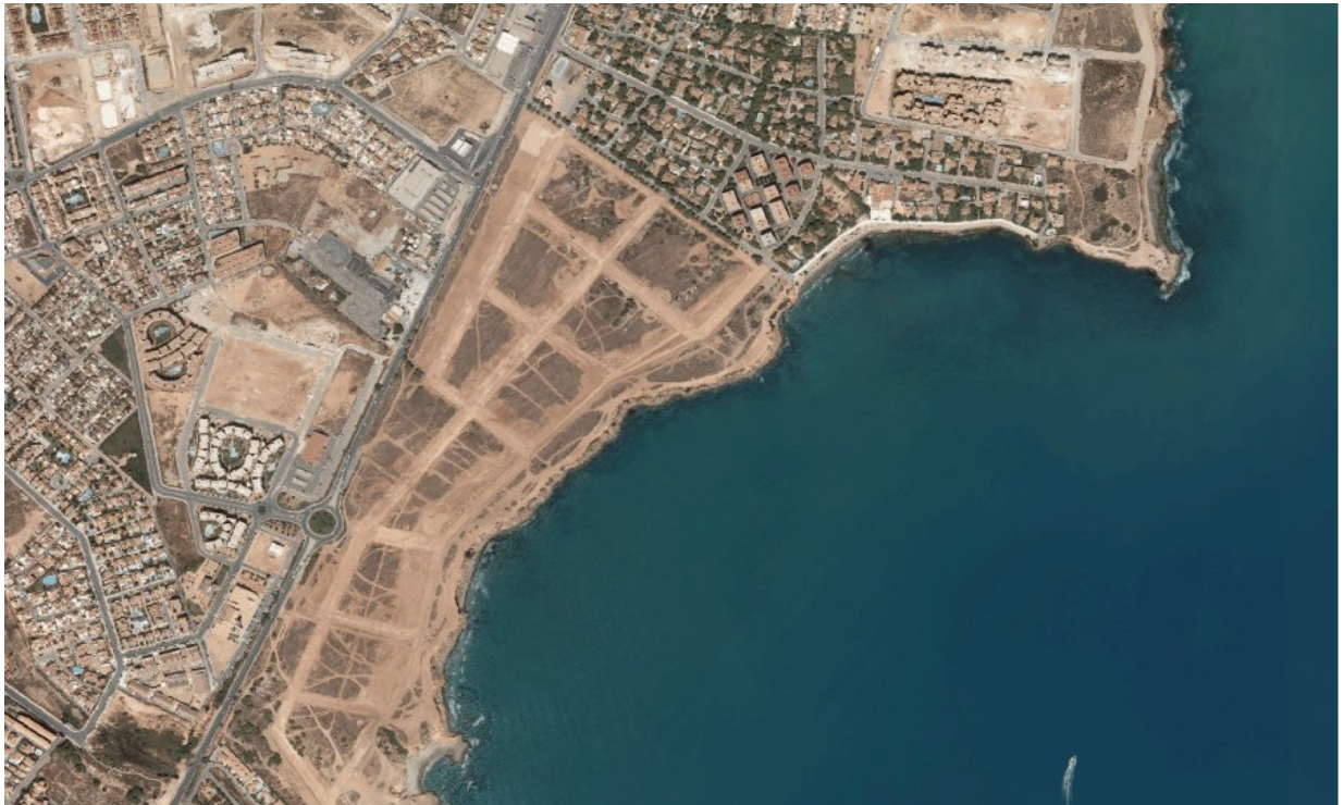
Ortofoto 2. Sector D-1 "Alameda del Mar", año 2007.