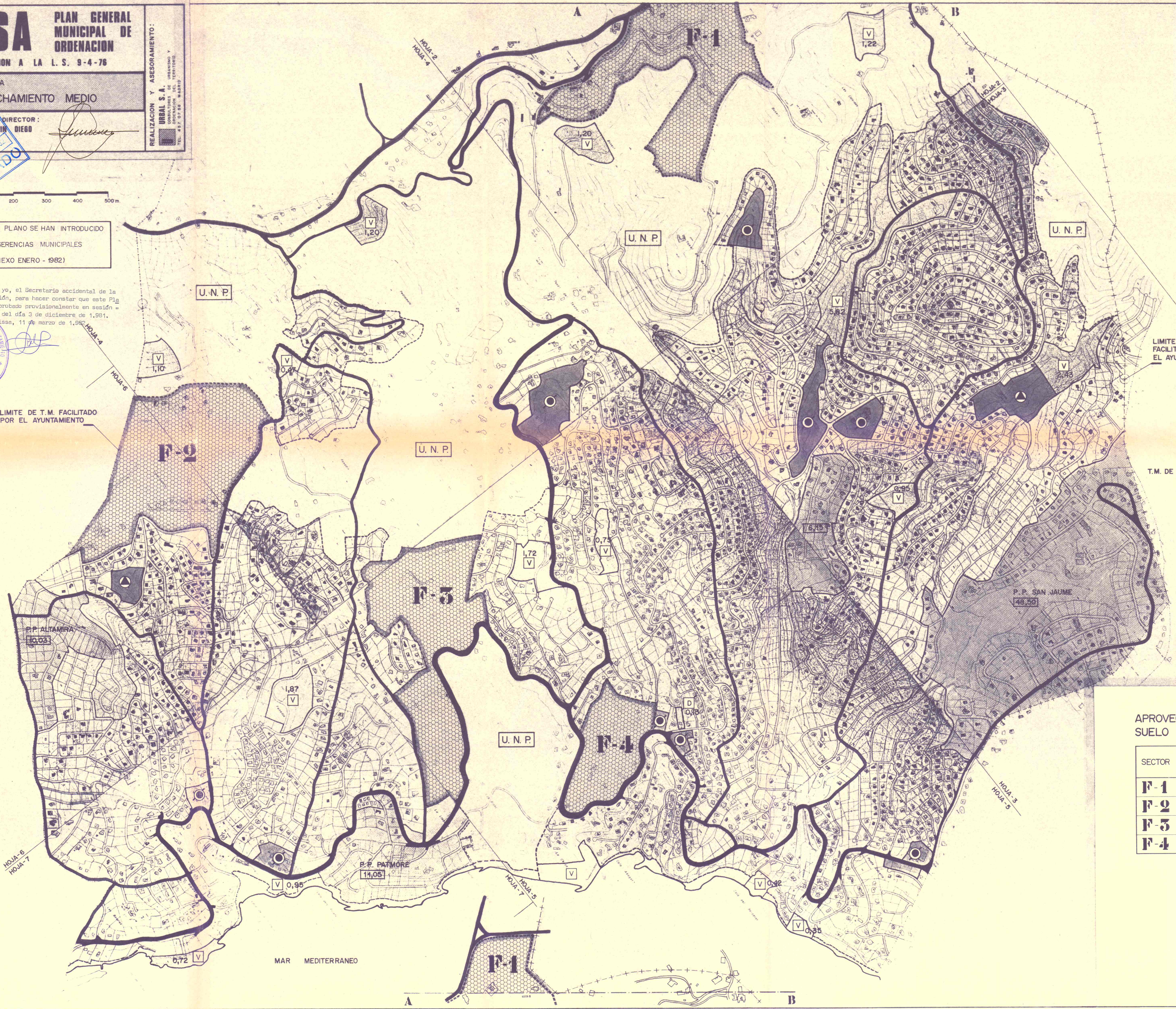
APROVECHAMIENTO MEDIO SUELO URBANIZABLE PROGRAMADO